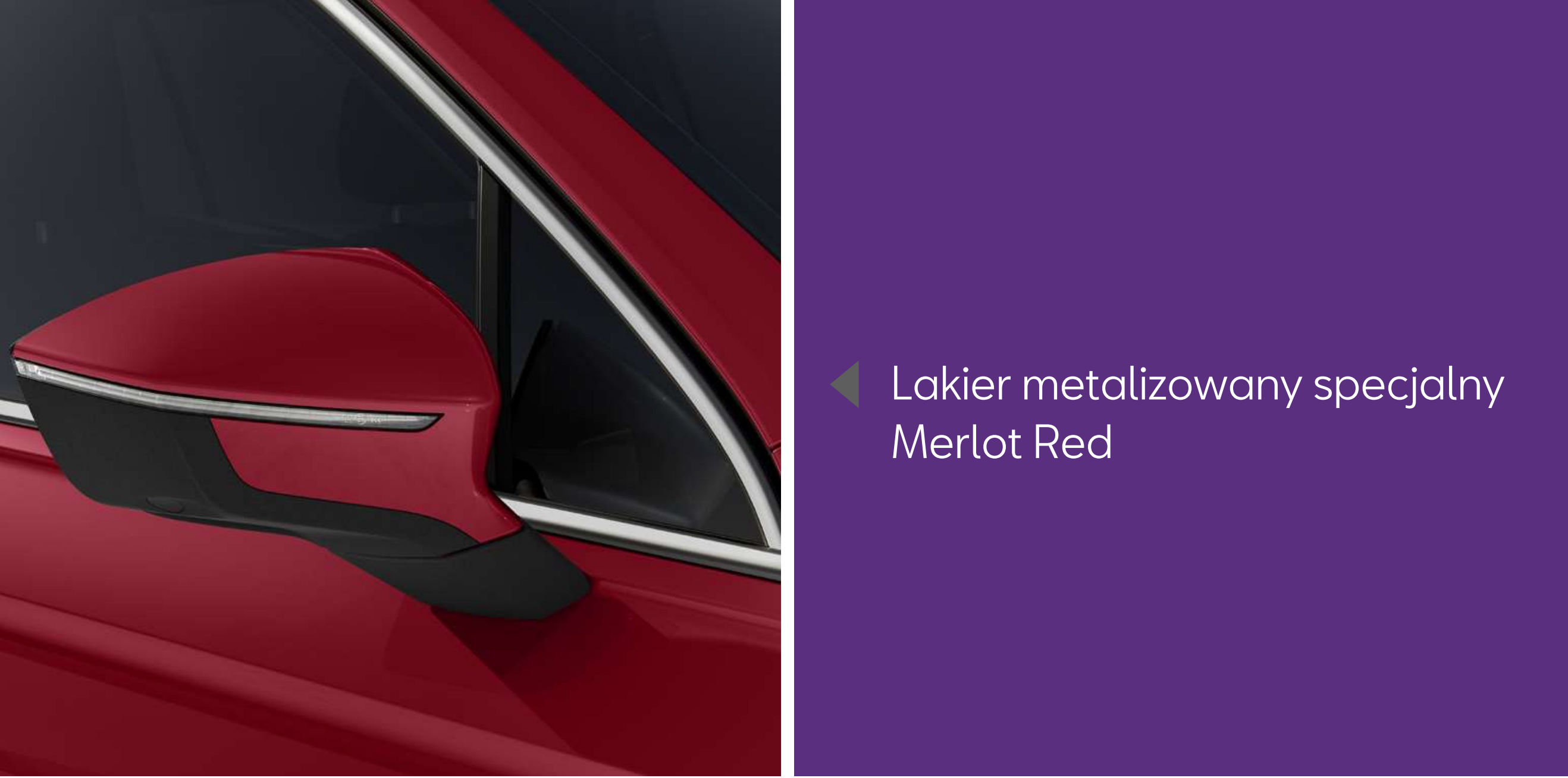
◀ Lakier metalizowany specjalny Merlot Red