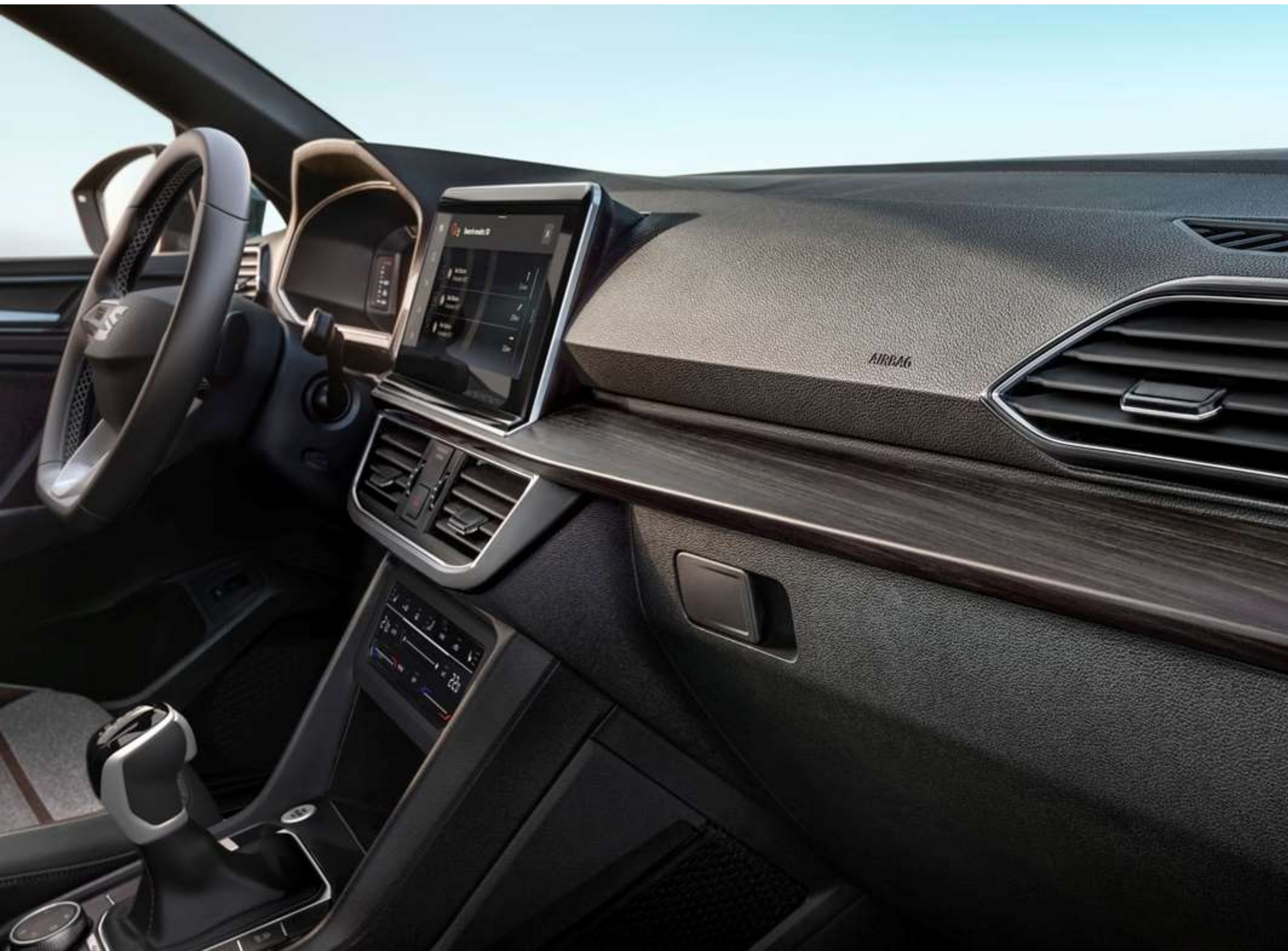
▼ Widok deski rozdzielczej z listwą dekoracyjną imitującą drewno