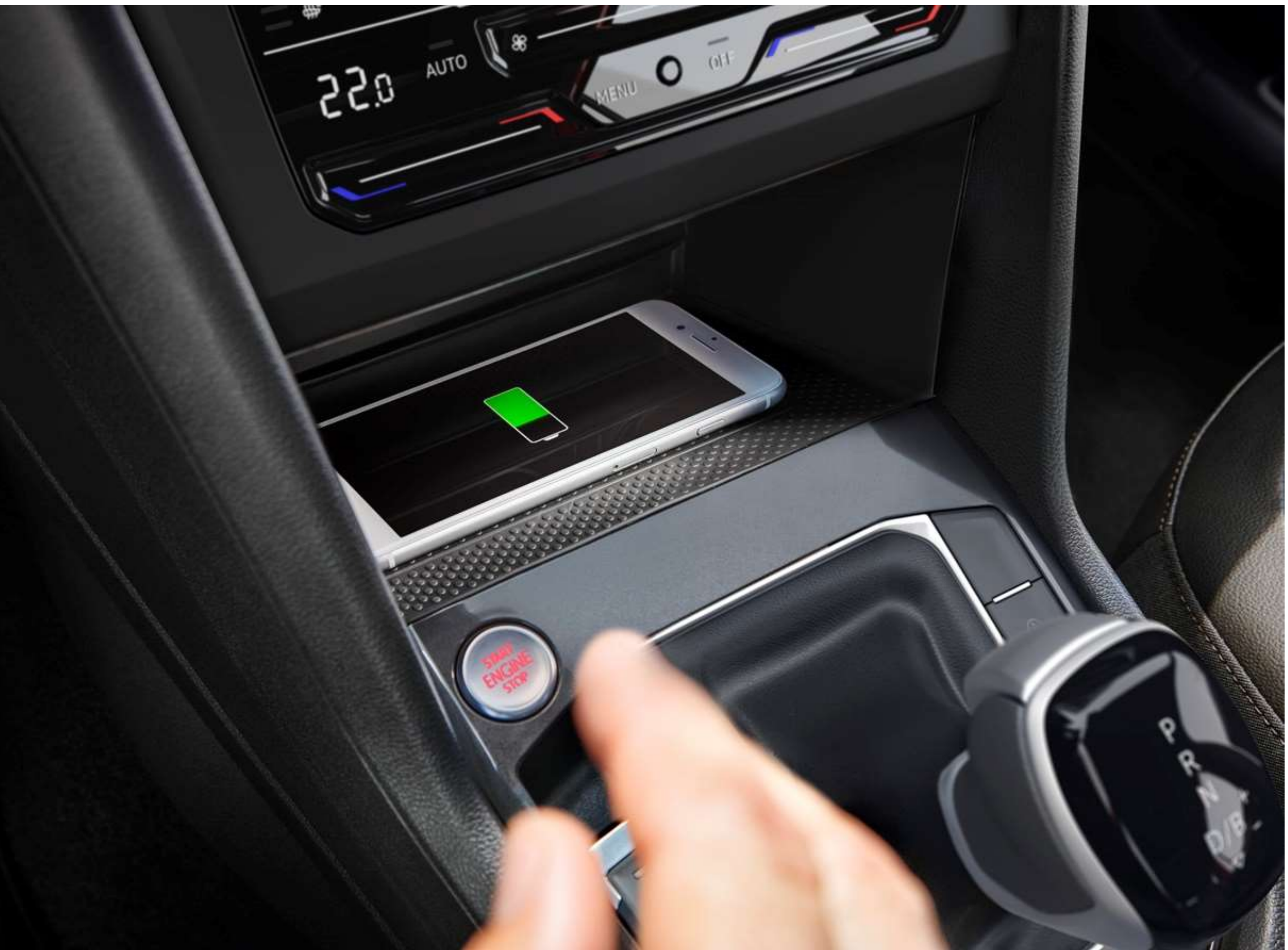
Schówek z funkcją ▲ beprzewodowego ładowania