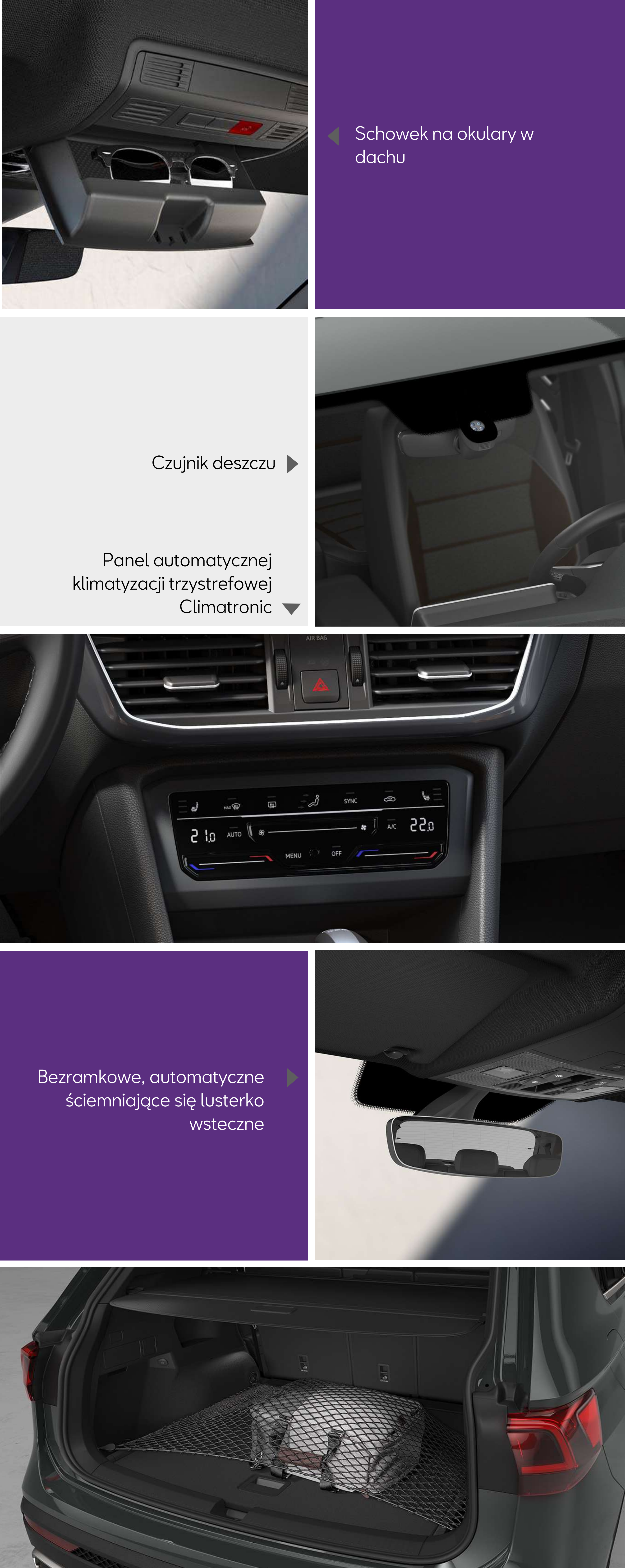
Schówek na okulary w dachu