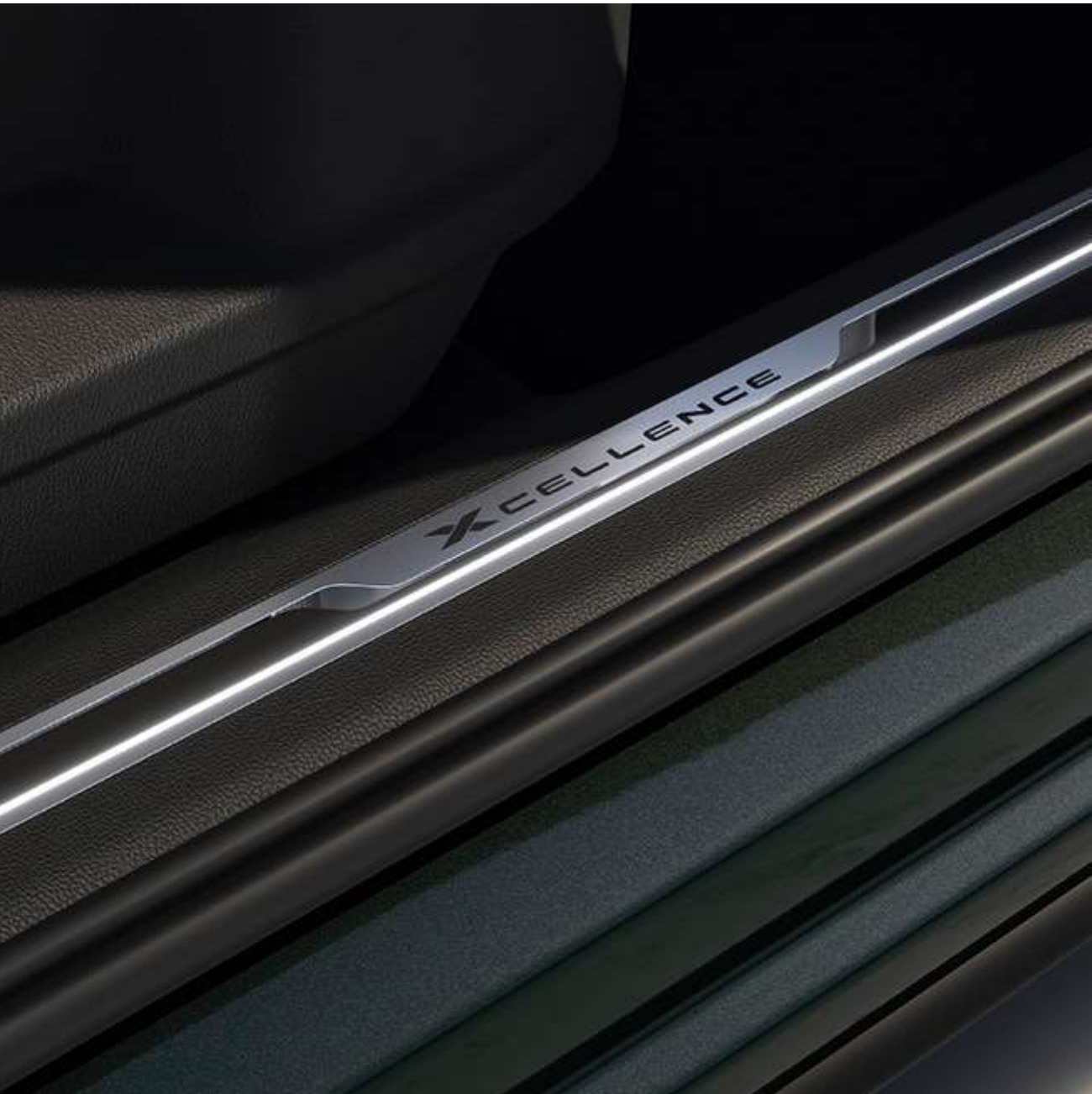
▶ Podświetlane nakładki progowe w technologii LED