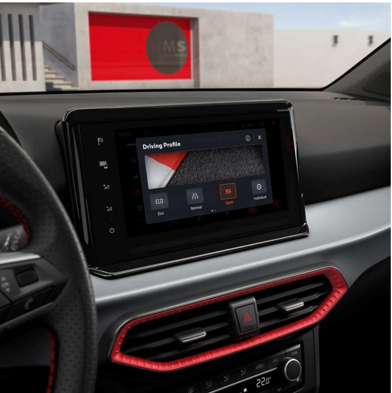
◀ SEAT Drive Profile