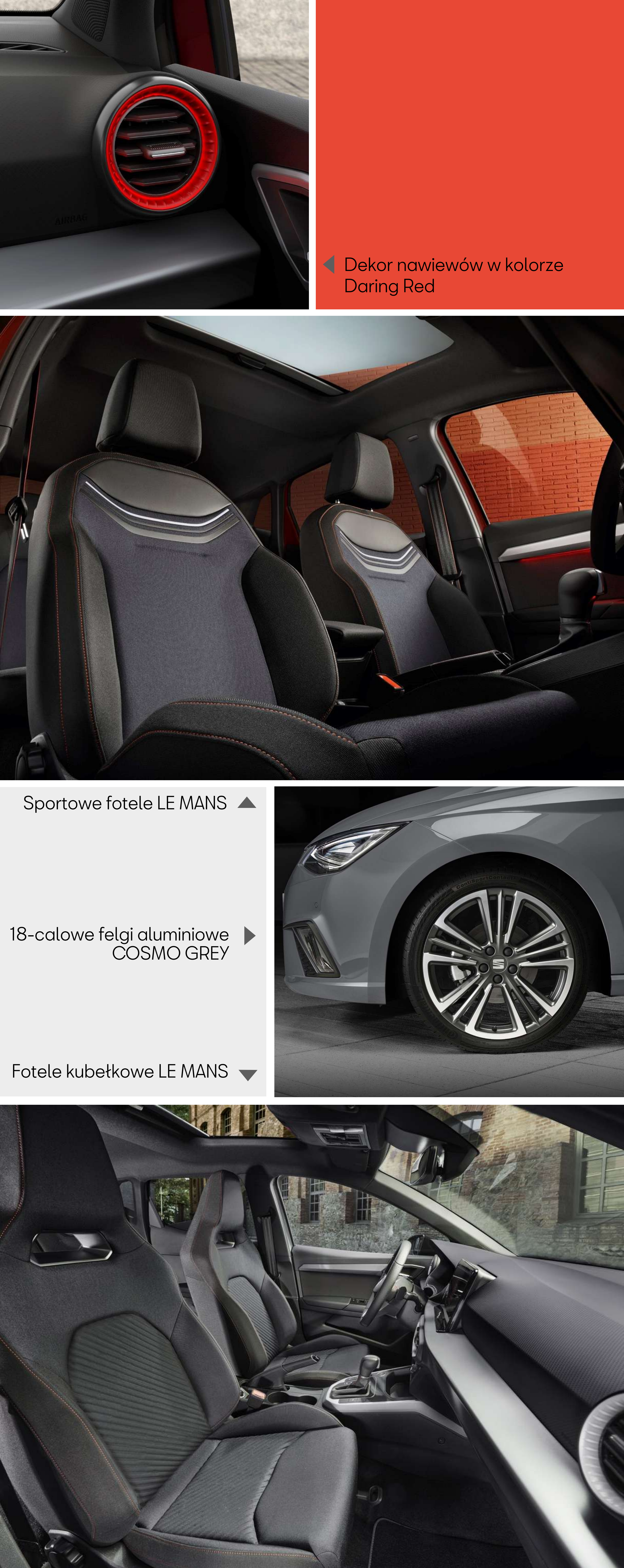
◀ Dekor nawiewów w kolorze Daring Red