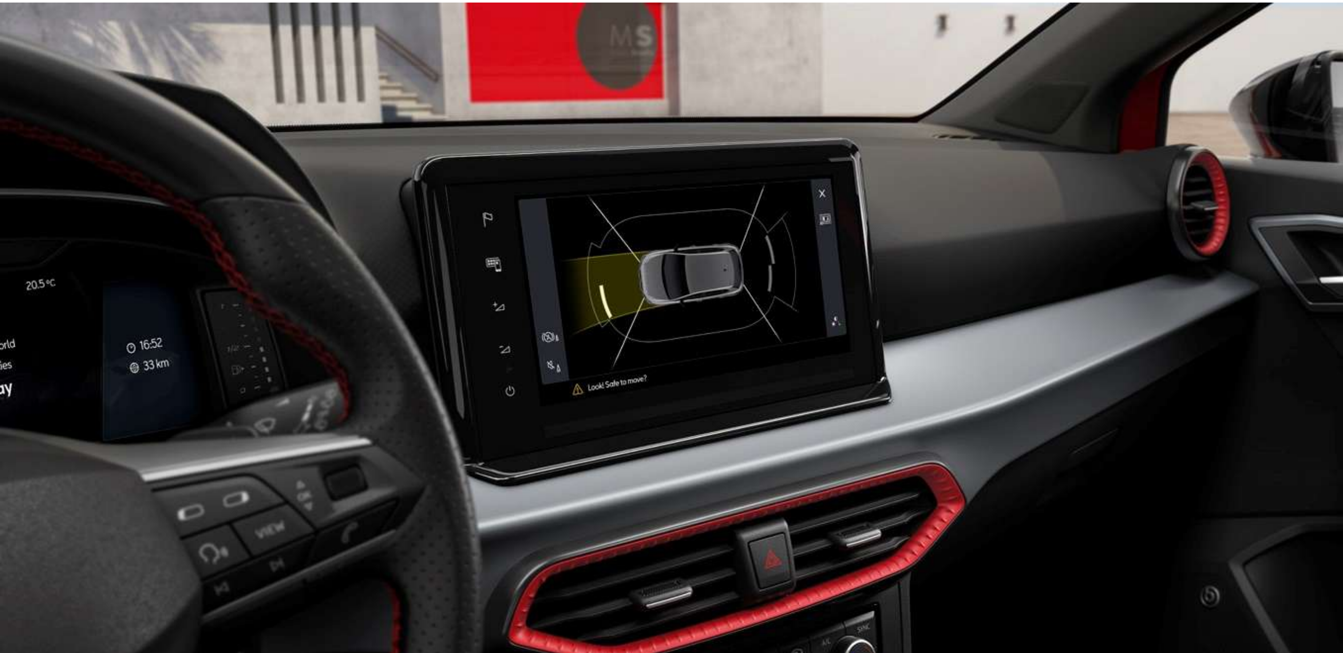
Czujniki parkowania z tyłu i przodu 2