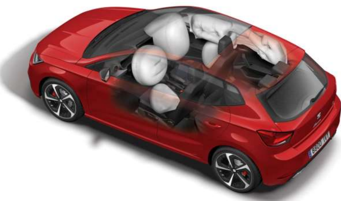
6 poduszek powietrznych 2